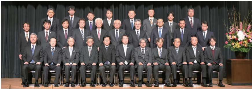
優良な工事を施工した企業の代表者

近年、人手不足や資材価格の高騰など業界を取り巻く環境は非常に厳しいものがあります。しかし、その中においても働き方改革や技術革新への取り組みをはじめ地域の経済や暮らしを支えることが強く求められています。本市といたしましても就労環境の改善や適正な利潤の確保、ICT活用などについて業界の皆さまの意見を伺いながらこうした課題に共に取り組んでいきたいと考えています。これからも安心・安全で災害に強いまちづくり、豊かで住みやすいまちづくりに向け、お力添えを賜りますようお願い申し上げます。