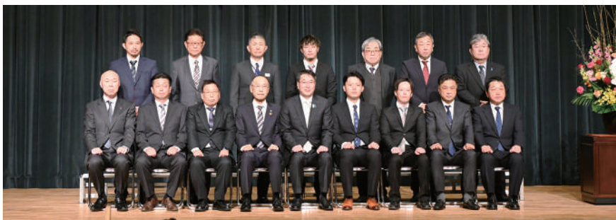
優良工事に貢献した下請企業表彰